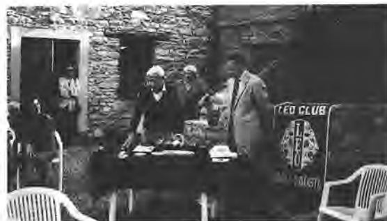
Premiazione dei vincitori della gara di golf organizzata dai Leos della Val d'Aosta sul campo di Arsanières

Il Torino La Mole sta predisponendo inoltre una "settimana bianca lions" dal 31 gennaio al 7 febbraio 1993.