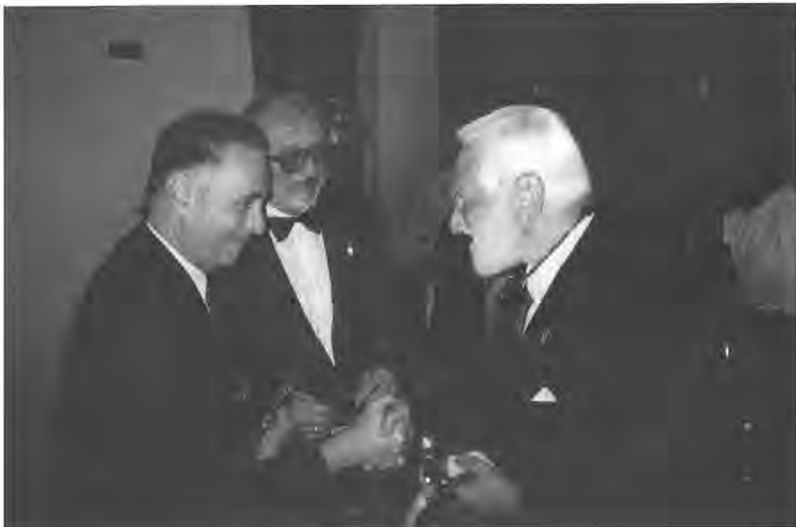
Giovedì 9 luglio a Sanremo, nella cornice di Villa Nobel il Governatore Machi ha potuto consegnare personalmente al Premio Nobel Sabin la targa di "Melvin Jones" che era stata assegnata allo scienziato dal Distretto

4 giugno - Il dottor Trenta dell'ENEA ha svolto un'interessante relazione sullo stato dell'energia nel nostro Paese. Ha spiegato come l'Italia sia quasi completamente dipen-