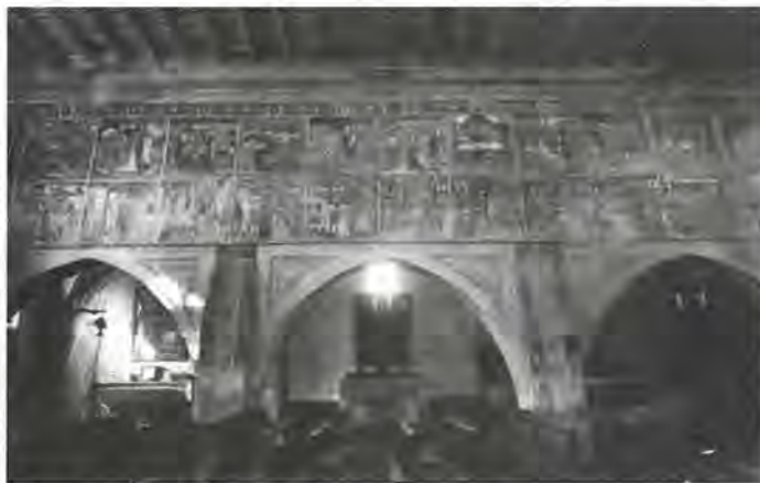
La grande parete affrescata della chiesa di San Maurizio

La Chiesa Vecchia, attigua al cimitero di San Maurizio Canavese, edificata in forme romaniche verso il Mille, è uno dei monumenti più interessanti del Piemonte sia per la parte architettonica, sia per il grandioso ciclo della vita di Cristo, dipinto nel 1495 dai Serra di Pinerolo e comprendente 24 scene. Una parte di quei dipinti era nota da tempo, seppure trascurati dagli esperti. Negli scorsi anni fu ottenuto dalla Regione Piemonte un buon intervento di ripulitura e consolidamento, peraltro già bisognoso di verifica. Altri lavori da ricordare sono il rifacimento del tetto a cura dell'amministrazione comunale ed il restauro del trittico cinquecentesco dell'Adorazione dei Magi, attuato 10 anni fa grazie al Lions Club Valli di Lanzo.