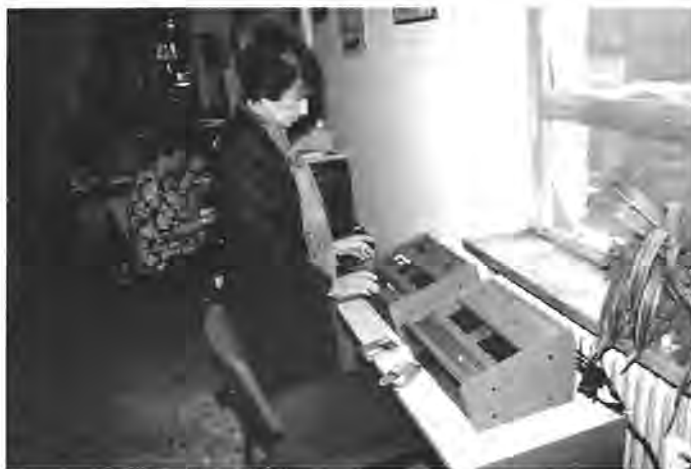
Le avanzate macchine per la riproduzione rapida delle cassette