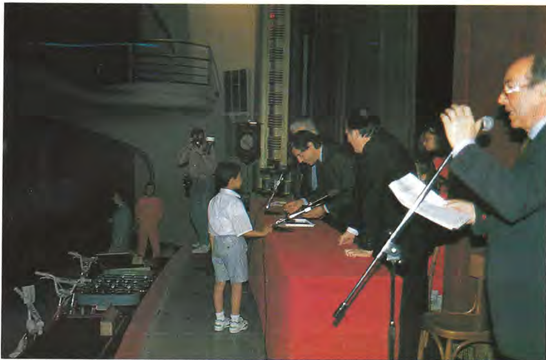
La sensibilizzazione alla donazione del sangue: concluso al Teatro Alfieri il concorso bandito dal Torino Host e dalla FIDAS