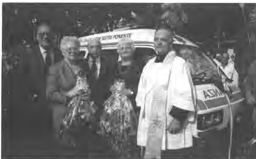
L'on. Biondi è intervenuto alla consegna dell'ambulanza alla Croce Verde sestrese

27 giugno - Il Club ha consegnato alla Croce Verde di Sestri Ponente l'Autoambulanza. La cerimonia ha avuto luogo in Piazza Baracca, alla presenza di un folto pubblico con la partecipazione del Vice Presidente della Camera On. Alfredo Biondi.