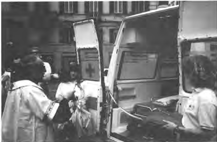
La benedizione della terza ambulanza attrezzata donata dalle Lioness di Torino