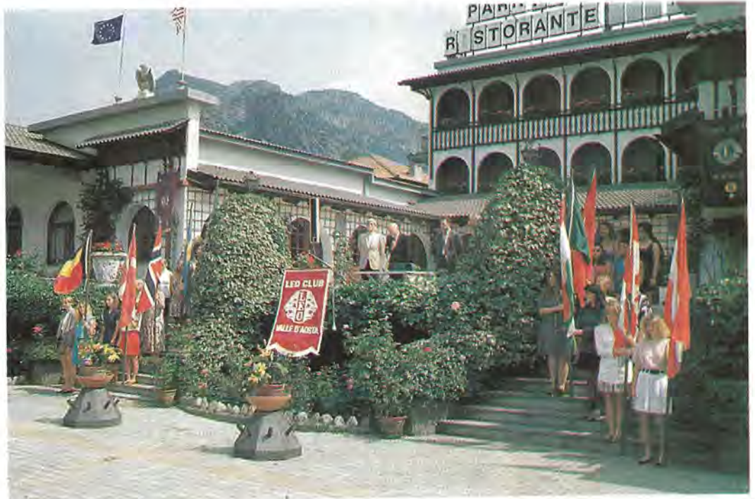
Un momento della parata delle dieci bandiere che ha aperto il "Campo Giovani" a Verrès

Le 21 ragazze ospiti del Campo - due svedesi, due norvegesi, due danesi, due belghe, una canadese, un'austriaca, una portoghese, tre ungheresi, cinque turche e due italiane - al suono degli inni americano ed italiano sono discese dalle scalinate, che uniscono la terrazza dell'albergo con un'ampia spianata antistante, sventolando le bandiere dei rispettivi Paesi, e mentre i fotografi e gli operatori della rete