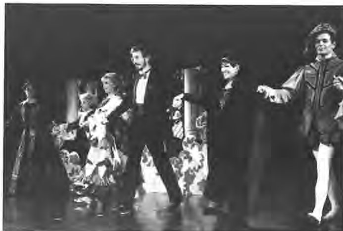
Lo spettacolo è terminato: gli attori ringraziano

Le marionette sono state trovate: preziosissime, quelle di