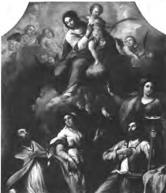
Madonna col Bambino e quattro Santi (particolare)

Varca dunque i confini quello che, probabilmente, è l'ultima iniziativa collettiva delle Lioness ma che, come scriveva Adriana Sangianantoni nell'articolo pubblicato sulla nostra rivista, poteva gettare le basi a Torino per una rassegna del cinema dei ragazzi fatto dai ragazzi.